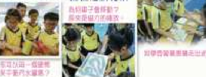
你可以用一個塑膠瓶製成保冷水瓶嗎?