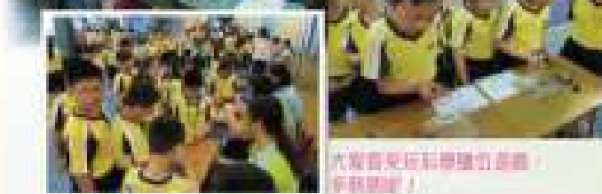
大家齊來玩科學吧! 把難題變簡單!